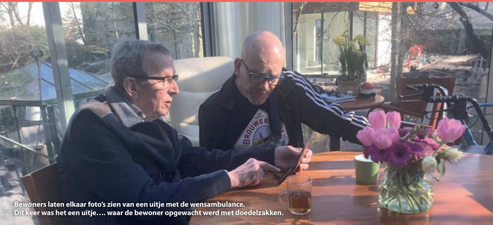
Bewoners laten elkaar foto's zien van een uitje met de wensambulance. Dit keer was het een uitje.... waar de bewoner opgewacht werd met doedelzakken.